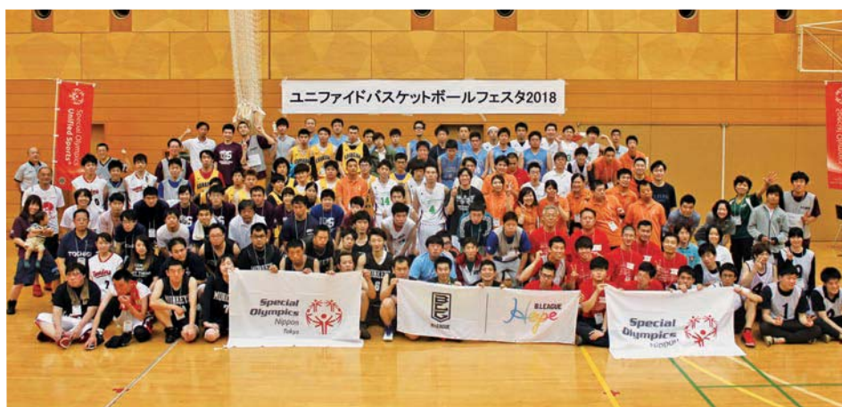
中央の旗に注目! 本大会はプロバスケットボールの「Bリーグ」も応援してくれました

国立オリンピック記念青少年総合センターにて、ユニファイドバスケットボールをみんなで楽しむ「お祭り」が開催されました。