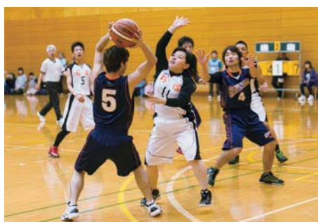
本大会の特別ルールで、男女混合チームも参戦

これまでサッカーで2回、ユニファイドプログラムの全国大会が開かれましたが、アスリート数が多いバスケットボールの大会は行われていませんでした。そこで、まずユニファイドの形式を採用したゲームによる全国規模のイベントを開き、今後の発展につなげていこうと、SON・東京のバスケットボールプログラムのコーチが積極的に取り組み、今回のイベントを実現させました。今回の経験を礎に、いずれ本格的なユニファイドバスケットボールの全国大会が開催されることを祈っています。