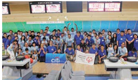
citiの皆様の中にはご家族で参加された方もいました

これは、世界中で活躍するシティグループの社員の方々が、ボランティア活動を通じて地域社会に貢献するというグローバルな取り組み。シティグループはSON・東京のオフィシャルスポンサーとして、資金的なサポートと多くの社員がボランティアとして参加していますが、今回のイベントでは、SON・東京のアスリートと一緒にボウリングを楽しむことで、より多くの社員に知的障害のある人々への理解を深めてほしい、という思いが込められたものでした。