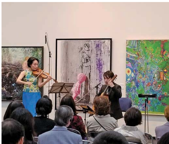
美術作品に囲まれ、バイオリンとギターの珍しい二重奏

ゴールデンウィーク直前の金曜日、スペシャルオリンピック日本・東京を支援する有志の会「ワンハンドレッド倶楽部」の懇親会が、上野の森美術館にて開催されました。今回は、「夏季ナショナルゲーム・愛知」への派遣支援を兼ねていたため、大会へ出場するアスリートたちも来場。ワンハンドレッド倶楽部の皆様からの激励に、感謝の気持ちと大会に向けた意気込みで応えました。